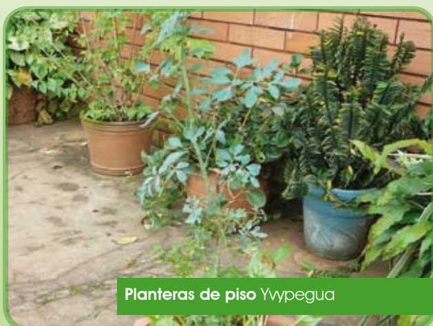
Planteras de piso Yvypegua