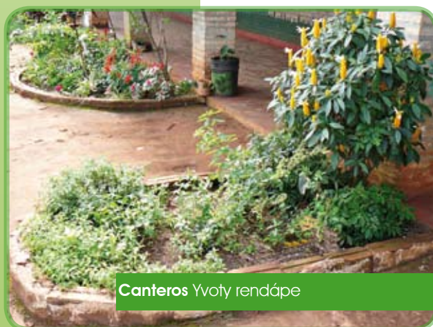
Canteros Yvoty rendápe