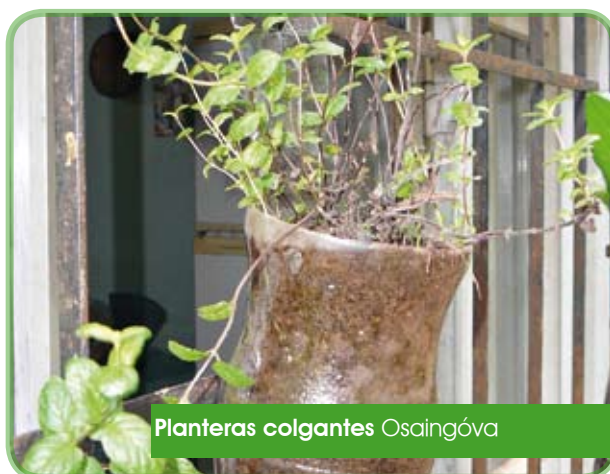
Planteras colgantes Osaingóva