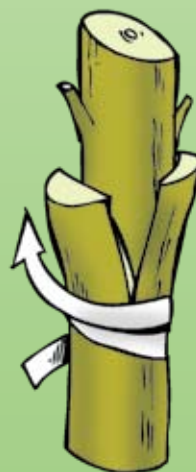
Injerto por púa