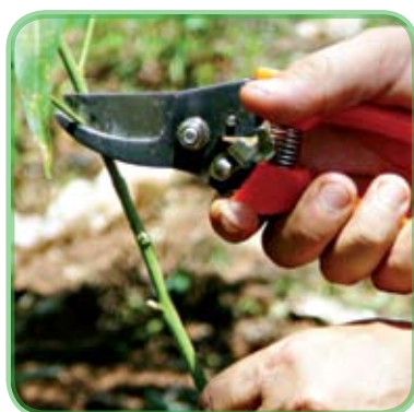
Corte de hojas de la vareta

d) Retiramos las hojas de la vareta (los cortes con hojas hace que las varetas pierdan rápidamente agua por medio de la transpiración).