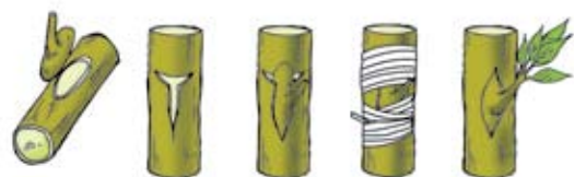
Injerto por yema