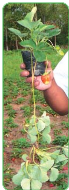
Plantin de frutilla

oĩ ningo yva ikatúva ñamoñemuña ita'ýra rupi hokýva hapo térã hopisãgui (pakova, yvasa'í, avakachi).