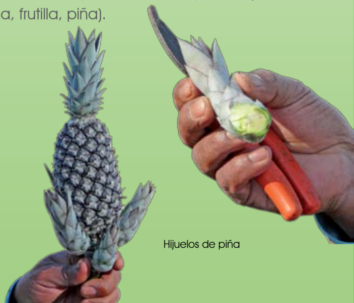
Hijuelos de piña

Algunas especies que rebrotan desde la raíz y desarrollan numerosos tallos, es posible dividirlos y obtener varias plantas (banana, frutilla, piña).